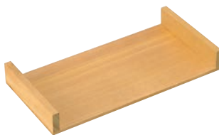
②EBM さわら 抜き板 C型