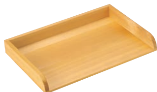
④EBM さわら 作り板 関東型