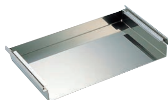
⑫SW 18-8 作り板