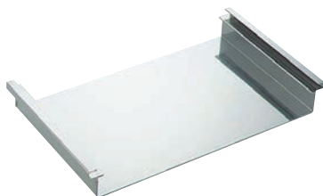
⑩EBM 18-8 作り板 背無