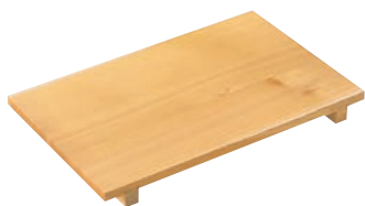
①EBM さわら 抜き板