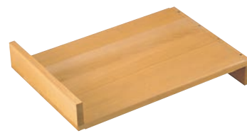
③EBM さわら 抜き板 関西型